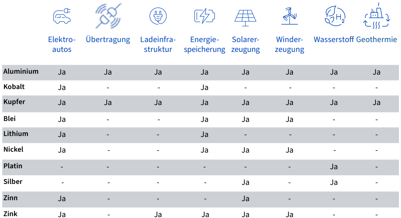
Abbildung 1: Rohstoffe und Anwendungen der Energiewende

die bis 2050 voraussichtlich 10 Milliarden Menschen erreichen wird, sowie die Senkung der Treibhausgasemissionen um über 100 %. Gleichzeitig werden Elektrofahrzeuge, Energiespeicherung und erneuerbare Energien stark gefördert, was die Nachfrage nach bestimmten Bergbaurohstoffen ankurbelt.